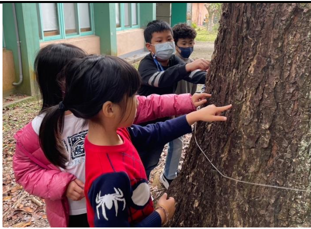
水尾巡禮，摸一摸校園大樹