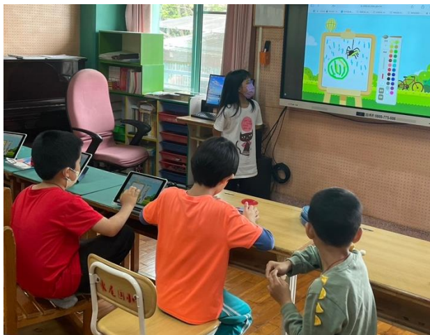
學生用平板畫出自己的「高麗菜」作品