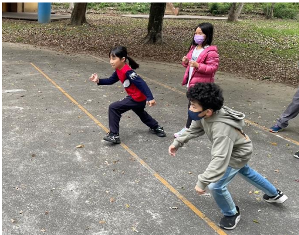
折返跑前，學生蓄勢待發