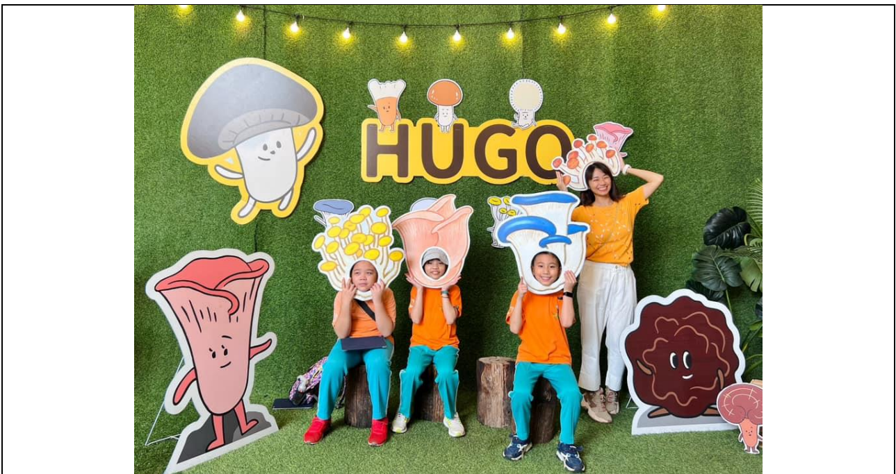
學生到埔里「豐年農場」採集在地產業色彩