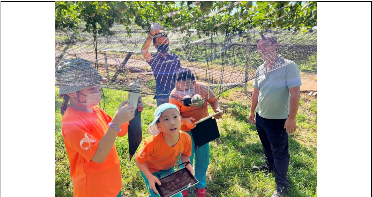
學生到埔里大坪頂「百香果園」採集在地產業色彩