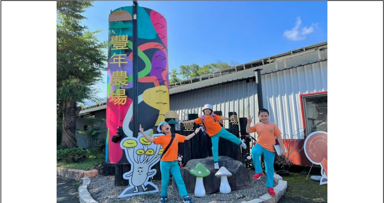
學生到埔里「豐年農場」採集在地產業色彩

檢核項目：5-3藝起來學學_親師合作爭取學生多元學習機會給孩子們不一樣的藝術饗宴、創意行銷提高學校能見度。