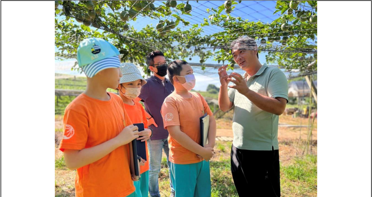
學生到埔里大坪頂「百香果園」採集在地產業色彩

檢核項目：5-3藝起來學學_親師合作爭取學生多元學習機會給孩子們不一樣的藝術饗宴、創意行銷提高學校能見度。